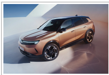
Opel Grandland (2024).