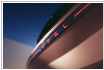
Opel Grandland (2024).