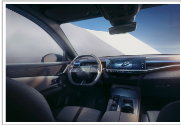
Opel Grandland (2024).