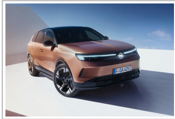
Opel Grandland (2024).