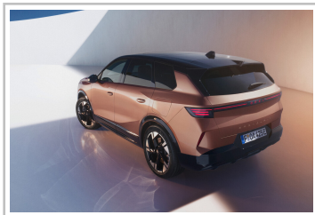
Opel Grandland (2024).