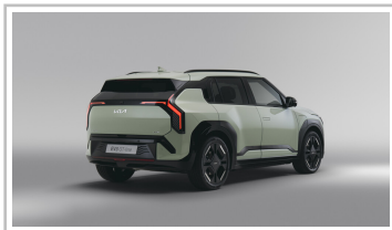
Kia EV3 GT-line.