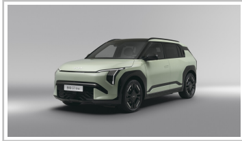
Kia EV3 GT-line.