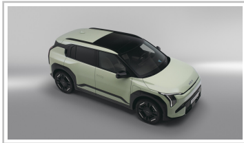
Kia EV3 GT-line.