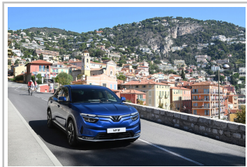
Vinfast VF 8 Plus.