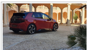
VW ID 3 GTX.