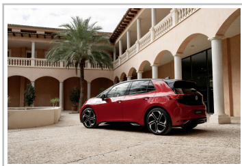
VW ID 3 GTX.