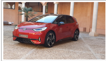
VW ID 3 GTX.