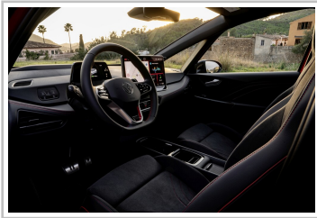
VW ID 3 GTX.