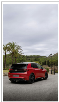
VW ID 3 GTX.