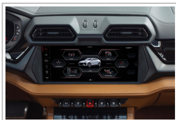
Lamborghini Urus SE.