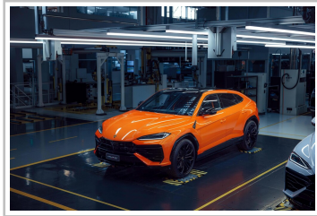
Lamborghini Urus SE.