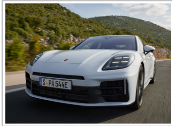
Porsche Panamera 4S E-Hybrid.