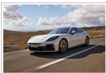
Porsche Panamera 4 E-Hybrid Executive.