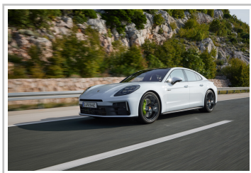
Porsche Panamera 4S E-Hybrid.