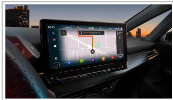
Cupra Born, Sondermodell „Edition Dynamic“.