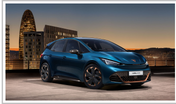
Cupra Born, Sondermodell „Edition Dynamic“.