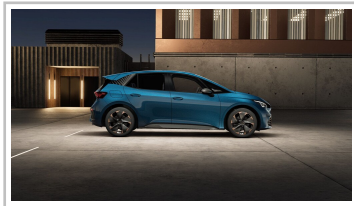
Cupra Born, Sondermodell „Edition Dynamic“.