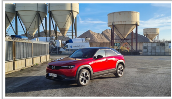
Mazda MX-30 R-EV.