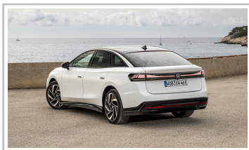
VW ID 7.