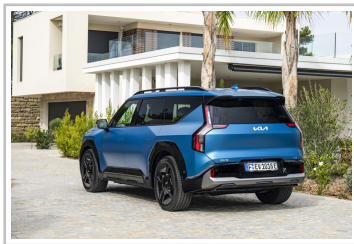
Kia EV9 GT-Line.