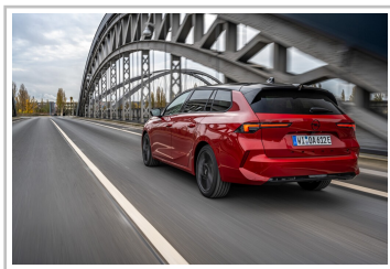
Opel Astra Sports Tourer Electric.