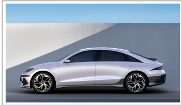
Hyundai Ioniq 6