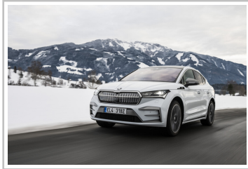
Skoda Enyaq Coupé, in der Version Laurin & Klement.