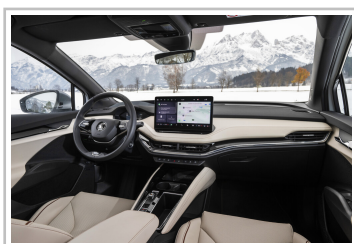
Skoda Enyaq Coupé, in der Version Laurin & Klement.