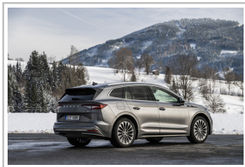
Skoda Enyaq 85x.