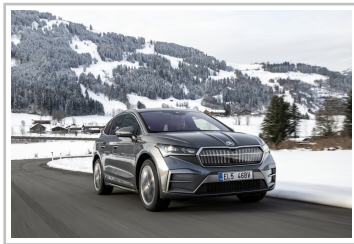
Skoda Enyaq 85x.