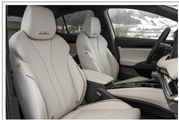
Skoda Enyaq Coupé, in der Version Laurin & Klement.