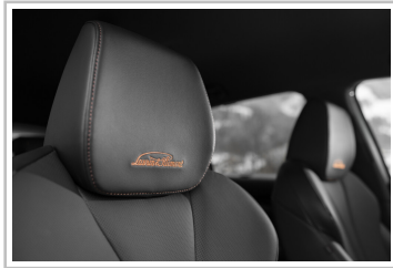
Skoda Enyaq Coupé, in der Version Laurin & Klement.