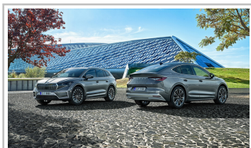
Skoda Enyaq 85.