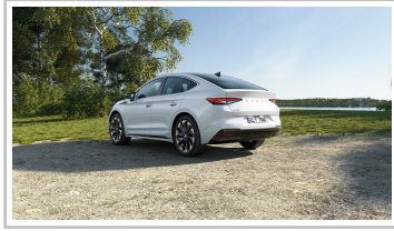
Skoda Enyaq 85 Coupé.