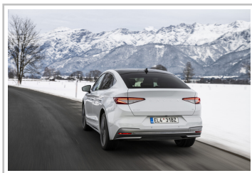
Skoda Enyaq Coupé, in der Version Laurin & Klement.