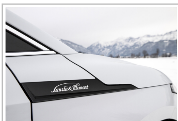
Skoda Enyaq Coupé, in der Version Laurin & Klement.