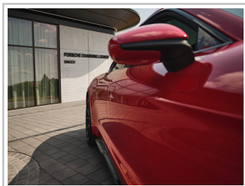
Porsche Charging Lounge bei Bingen am Rhein.