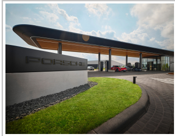
Porsche Charging Lounge bei Bingen am Rhein.