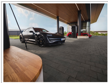
Porsche Charging Lounge bei Bingen am Rhein.