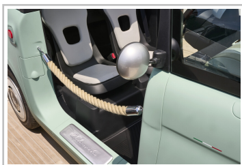
Fiat Topolino „Dolcevita“.