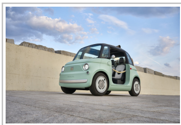
Fiat Topolino „Dolcevita“.