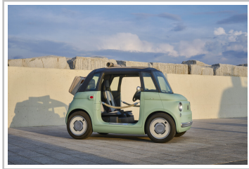
Fiat Topolino „Dolcevita“.