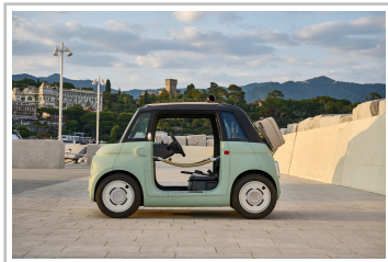
Fiat Topolino „Dolcevita“.