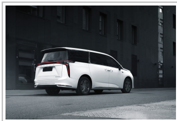
Maxus Mifa 9.