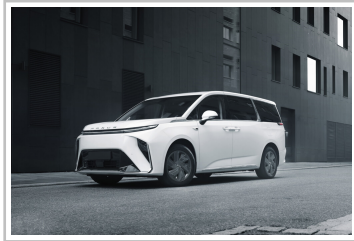
Maxus Mifa 9.