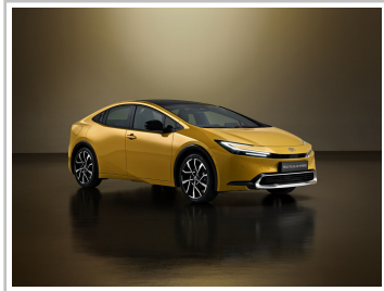
Toyota Prius Plug-in-Hybrid.