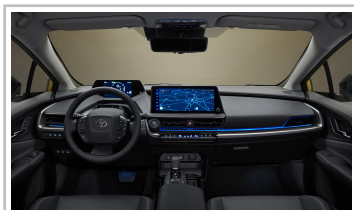
Toyota Prius Plug-in-Hybrid.