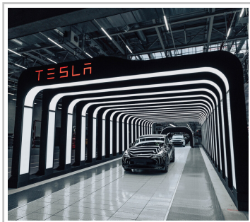
Produktion in der Tesla-Fabrik Berlin-Brandenburg in Grünheide.