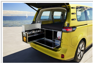
VW ID Buzz mit Campingbox von Ququq.