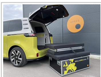
VW ID Buzz mit Campingbox von Ququq.