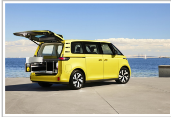
VW ID Buzz mit Campingbox von Ququq.