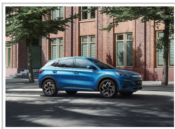
BYD Atto 3.