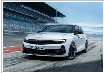
Opel Astra GSe.