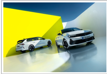
Opel Astra Sports Tourer GSe und Astra GSe.