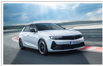
Opel Astra GSe.