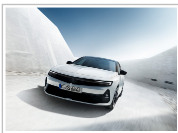
Opel Astra GSe.