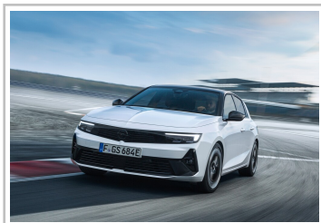
Opel Astra GSe.