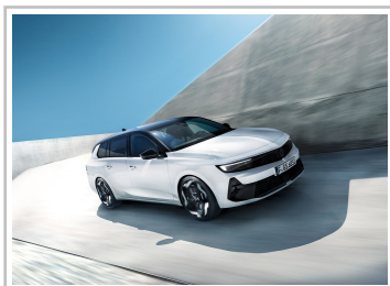
Opel Astra Sports Tourer GSe.