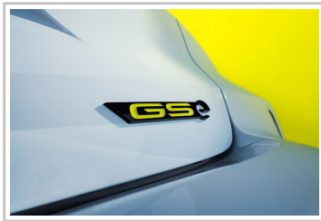
Opel Astra GSe.