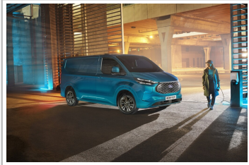
Ford E-Transit Custom.