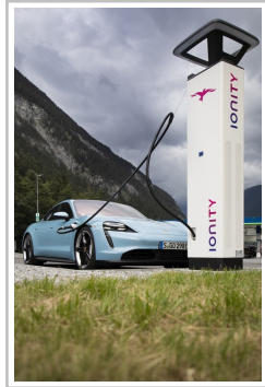
Porsche Taycan an einer Schnellladesäule von Ionity.