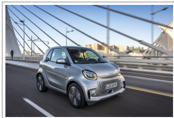
Smart EQ Fortwo.