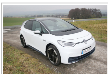
VW ID 3.