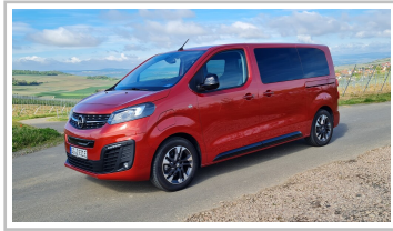
Opel Zafira-e Life.