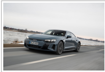
Audi e-Tron GT.