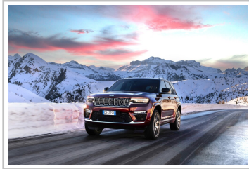
Jeep Grand Cherokee 4xe Exclusive Launch Edition.