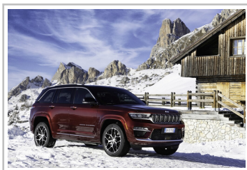
Jeep Grand Cherokee 4xe Exclusive Launch Edition.