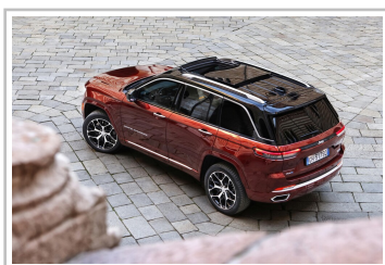
Jeep Grand Cherokee 4xe Exclusive Launch Edition.