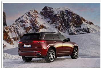
Jeep Grand Cherokee 4xe Exclusive Launch Edition.