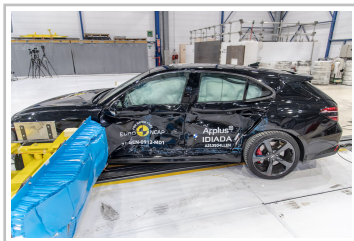
Genesis G70 Shooting Brake im Euro-NCAP-Crashtest.