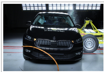
Skoda Fabia im Euro-NCAP-Crashtest.