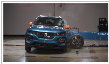
Dacia Spring im Euro-NCAP-Crashtest.