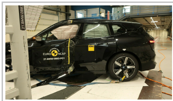
BMW iX im Euro-NCAP-Crashtest.