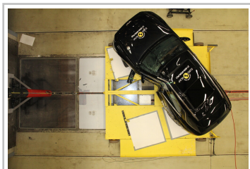
Genesis GV70 im Euro-NCAP-Crashtest.