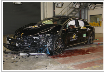
Mercedes EQS im Euro-NCAP-Crashtest.