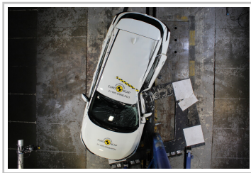
Nissan Qashqai im Euro-NCAP-Crashtest.