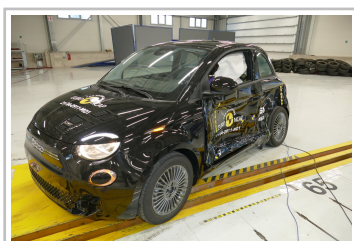
Fiat 500e im Euro-NCAP-Crashtest.