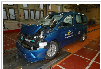
VW Caddy im Euro-NCAP-Crashtest.