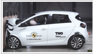
Renault Zoe im Euro-NCAP-Crashtest.