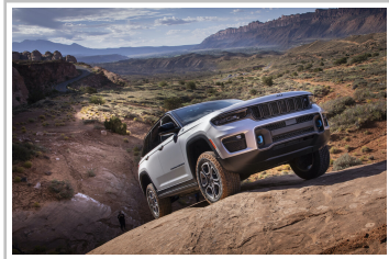
Jeep Grand Cherokee 4xe.