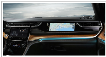
Jeep Grand Cherokee 4xe.