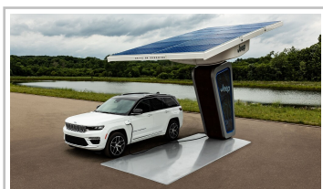
Jeep Grand Cherokee 4xe.