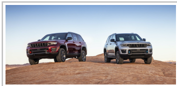
Jeep Grand Cherokee.