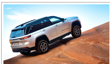
Jeep Grand Cherokee 4xe.