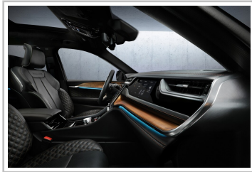
Jeep Grand Cherokee 4xe.