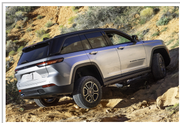
Jeep Grand Cherokee 4xe.