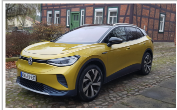
VW ID 4.