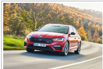
Skoda Octavia RS Plus Plug-in-Hybrid.