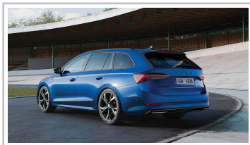
Skoda Octavia Combi Sportline.