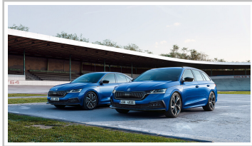
Skoda Octavia Sportline.