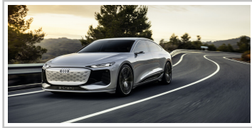
Audi A6 e-tron concept.