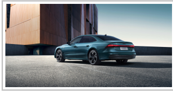
Audi A7 L.