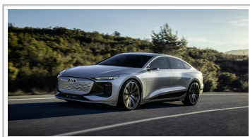
Audi A6 e-tron concept.