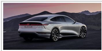
Audi A6 e-tron concept.