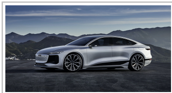
Audi A6 e-tron concept.