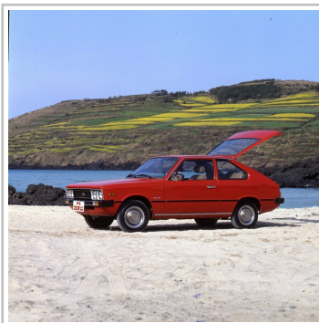
Hyundai Pony, erste Generation.