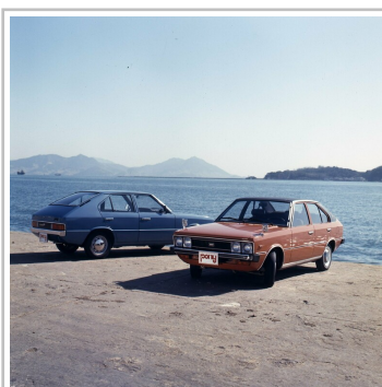
Hyundai Pony, erste Generation.