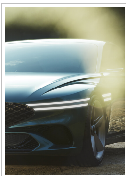
Genesis X Concept.