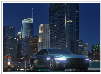
Genesis X Concept.