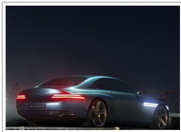
Genesis X Concept.