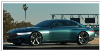
Genesis X Concept.