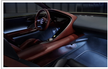
Genesis X Concept.