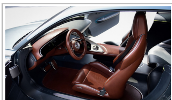
Genesis X Concept.