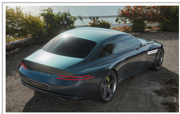
Genesis X Concept.