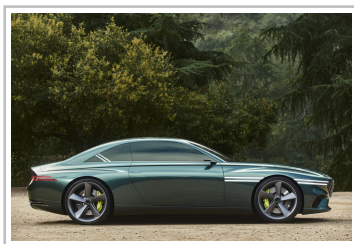
Genesis X Concept.