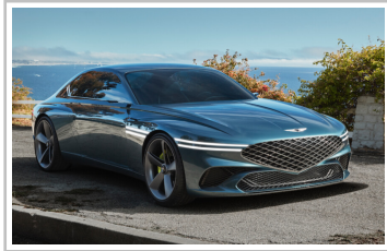
Genesis X Concept.