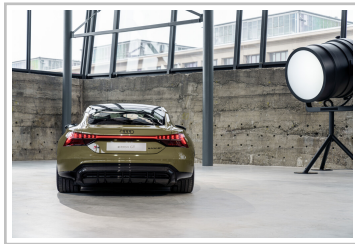
Audi e-Tron GT.