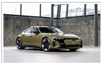
Audi e-Tron GT.