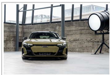
Audi e-Tron GT.