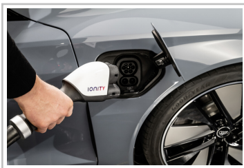
Audi e-Tron GT.