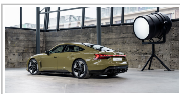
Audi e-Tron GT.