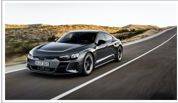
Audi RS e-Tron GT.