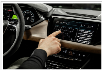
Audi e-Tron GT.