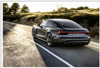
Audi RS e-Tron GT.