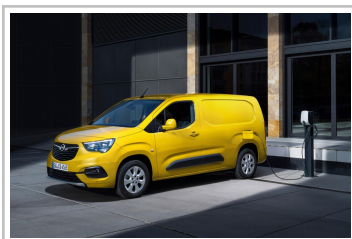
Opel Combo-e Cargo.