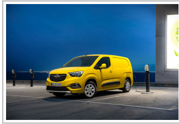
Opel Combo-e Cargo.