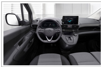
Opel Combo-e Cargo.