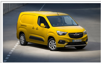
Opel Combo-e Cargo.