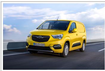
Opel Combo-e Cargo.