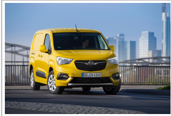
Opel Combo-e Cargo.