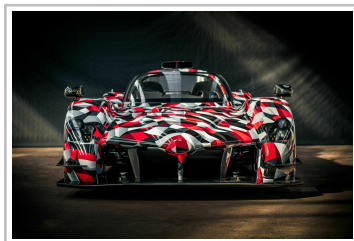
Toyota TS050 Hybrid.