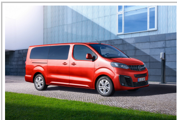
Opel Zafira-e Life L.