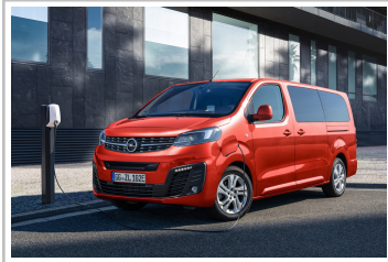
Opel Zafira-e Life L.