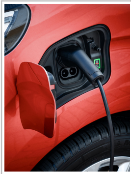
Opel Zafira-e Life.