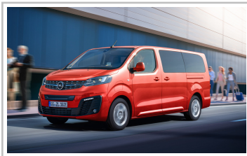
Opel Zafira-e Life L.