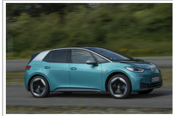
Volkswagen ID 3.