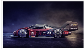
Volkswagen ID R.