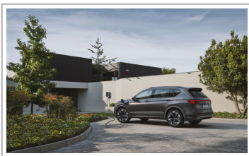
Seat Tarraco FR PHEV.