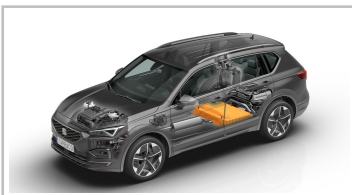
Seat Tarraco FR PHEV.