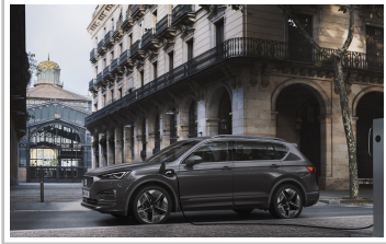
Seat Tarraco FR PHEV.