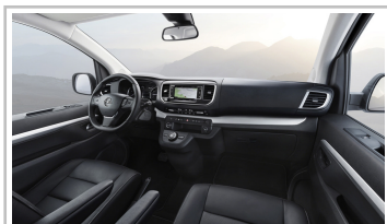
Opel Zafira Life.