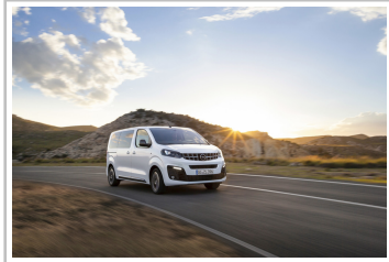
Opel Zafira Life.