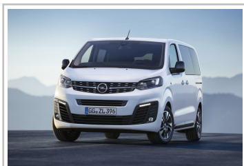
Opel Zafira Life.