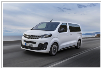
Opel Zafira Life.