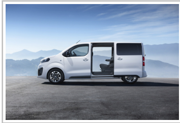
Opel Zafira Life.