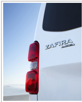
Opel Zafira Life.