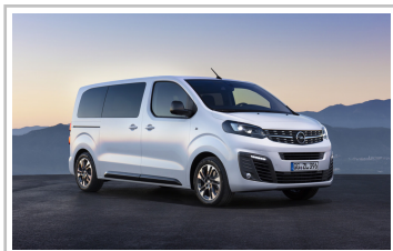
Opel Zafira Life.