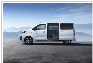
Opel Zafira Life.