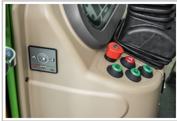
Fendt eVario 100.