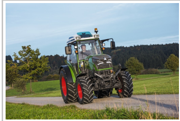
Fendt eVario 100.