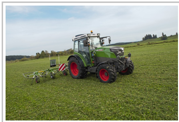
Fendt eVario 100.