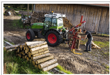
Fendt eVario 100.