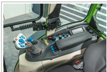
Fendt eVario 100.