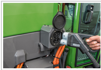
Fendt eVario 100.