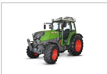
Fendt eVario 100.