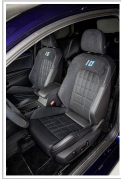
Volkswagen Golf GTI First Decade.