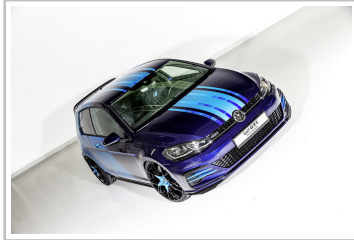
Volkswagen Golf GTI First Decade.