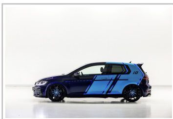
Volkswagen Golf GTI First Decade.