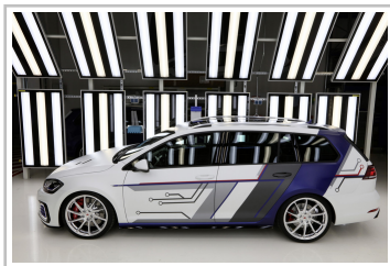
Volkswagen Golf GTE Variant impulsE.