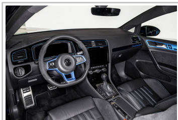
Volkswagen Golf GTI First Decade.