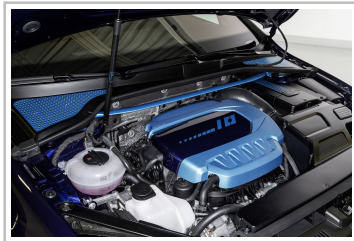
Volkswagen Golf GTI First Decade.