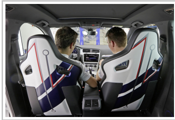
Volkswagen Golf GTE Variant impulsE.