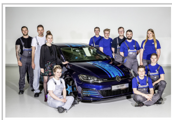
Volkswagen Golf GTI First Decade mit einigen der Auszubildenden.