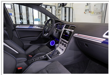
Volkswagen Golf GTE Variant impulsE.