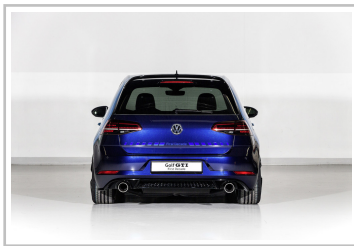
Volkswagen Golf GTI First Decade.