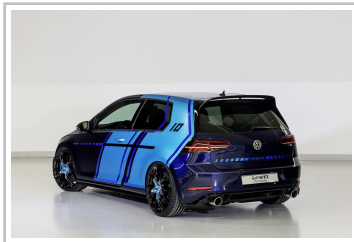
Volkswagen Golf GTI First Decade.