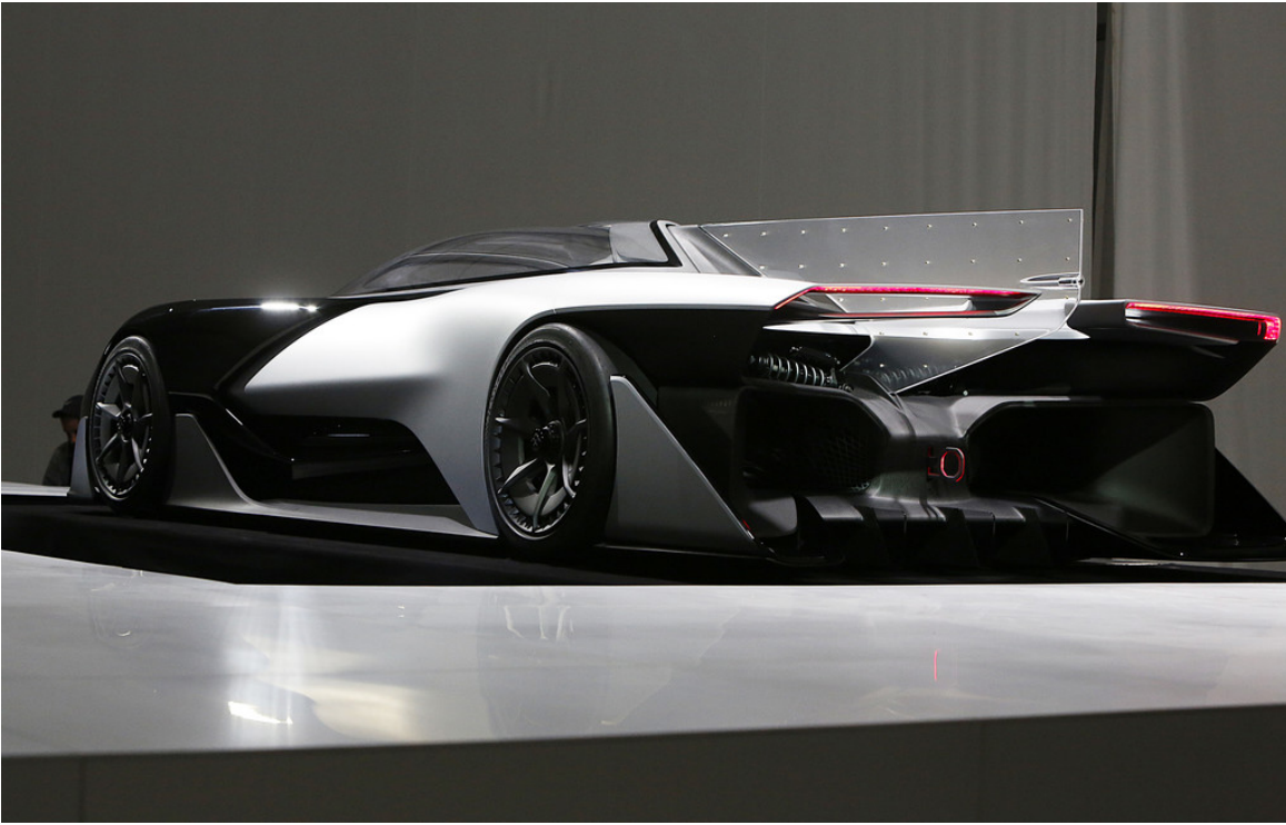
FF Zero 1.