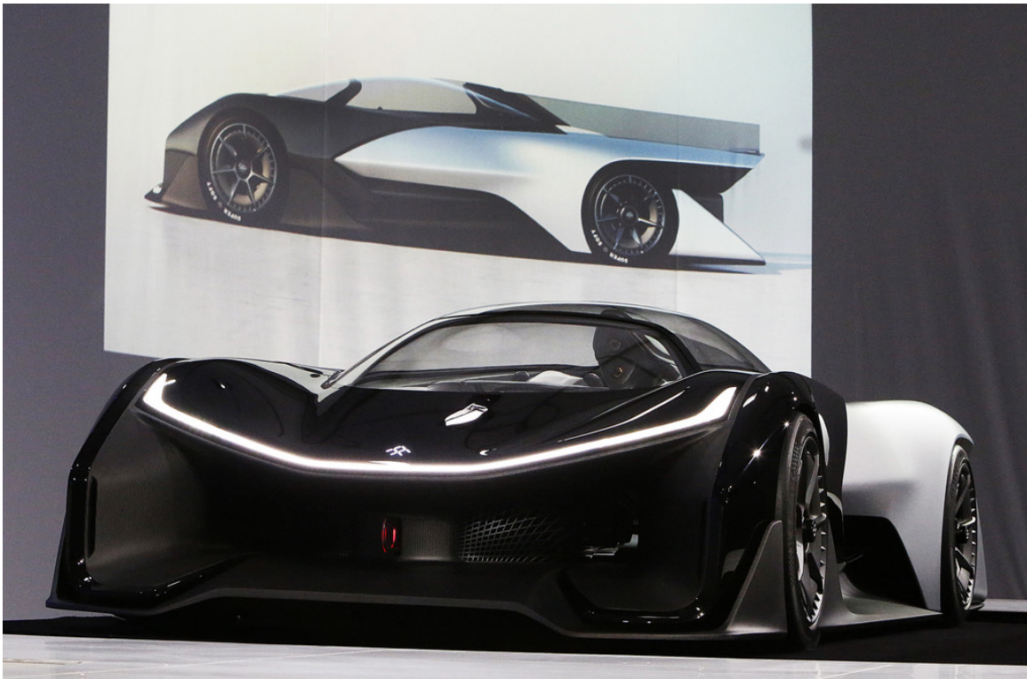
FF Zero 1.