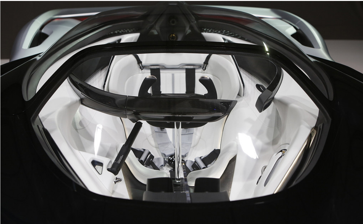
FF Zero 1.